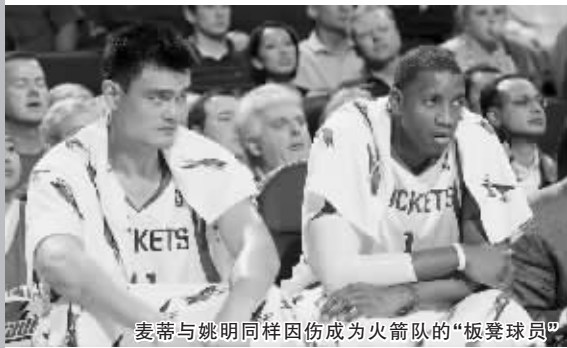
麦蒂与姚明同样因伤成为火箭队的“板凳球员”

本报综合消息 经历了整整8个月的左膝术后恢复,麦蒂在北京时间11月10日传递出了振奋火箭阵营的好消息——他亲口向美国权威媒体雅虎体育证实:他计划在11月18日(北京时间19日)复出!