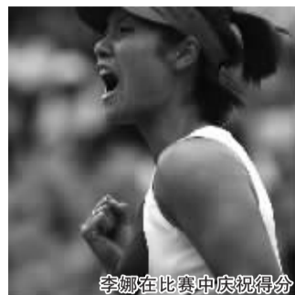
李娜在比赛中庆祝得分

据新华社电 中国女网球员李娜曾说,她最不愿意的就是比赛打第三盘,因为那样她会很紧张。但昨天她恰是以这种“最不愿意”的方式在澳网赢了球。李娜赛后表示,能在先输一盘的情况下反败为胜,让她的自信心更强了。