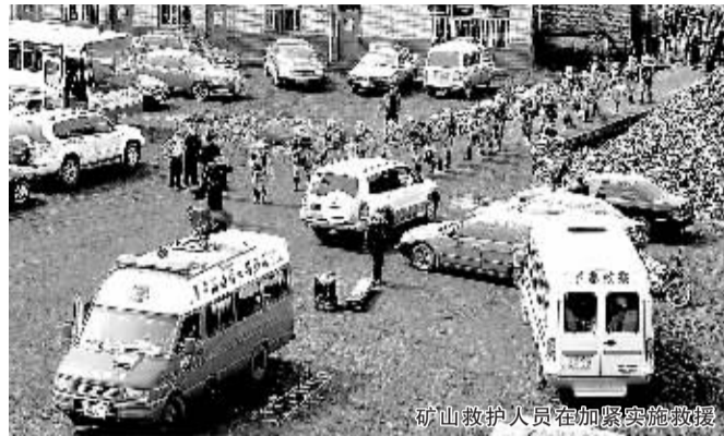
矿山救护人员在加紧实施救援

员逃跑,加之矿灯房倒塌后将下井人员名单压埋,给确定下井人数带来巨大困难。 目前河南省正组织各方力量全力开展营救。同时还采取措施维护通风系统稳定正常工作,防止有害气体进入矿井内产生次生灾害。还打开了一个废弃的矿井口,给有还希望的矿工开辟了“生命通道”。 据河南省安监局有关负责人介绍,该矿设计产能为15万吨,是资源整合技术改造矿井,属停工停产期间违规生产。井下现场管理混乱,违反瓦斯管理相关规定。