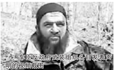
车臣反政府武装组织头目发表声明的视频截图

新华社莫斯科4月1日电 车臣反政府武装3月31日在互联网上发布消息,宣称对3月29日发生在莫斯科地铁内的两起爆炸事件负责,并声称将继续在俄罗斯境内发动袭击。