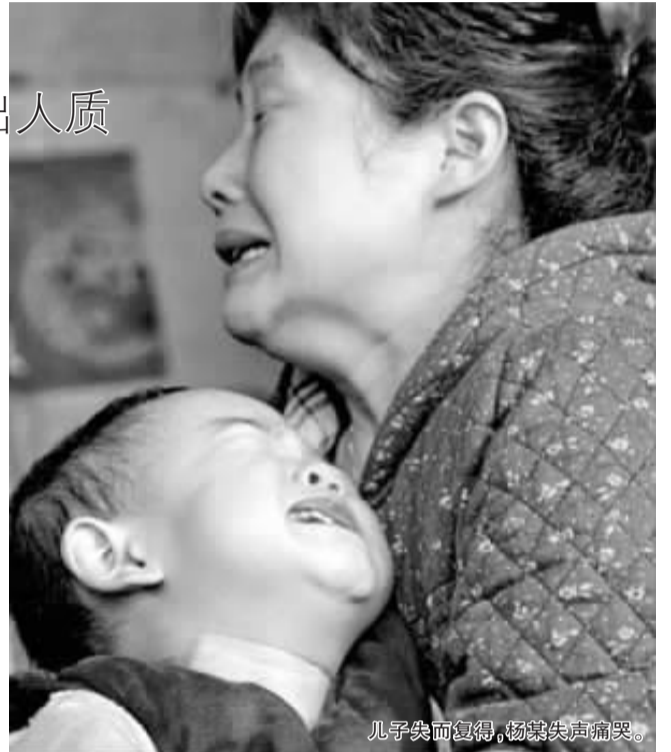
儿子失而复得，杨某失声痛哭。

此时，在大沥派出所内的杨某夫妇见到儿子平安归来，立即冲上去从民警手中接过豪仔，一家三口紧紧拥抱在一起。杨某满脸泪水，搂着儿子生怕再次被人抱走，不停地“感谢警察”。