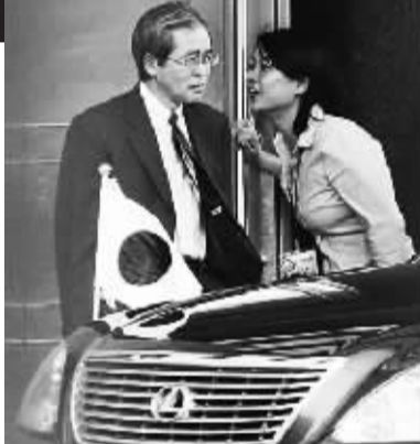
2日,在俄罗斯首都莫斯科,日本驻俄大使河野雅治(左)从使馆走出。

不过,菅直人本人当天晚些时候告诉媒体记者,他与梅德韦杰夫“会面的前景不确定”。日本外相原说,“尚未决定”是否举行日俄首脑会谈。