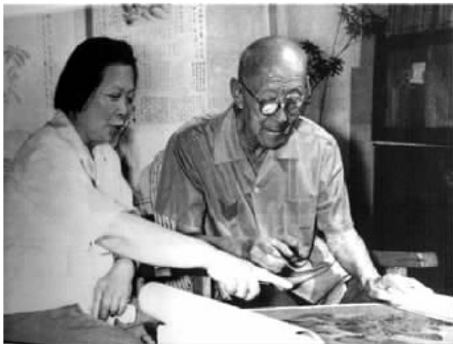
张伯驹与夫人潘素