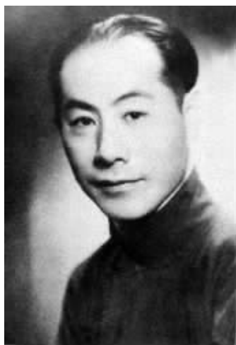
张伯驹青年时期照片