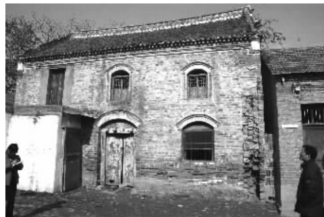
位于项城市秣陵镇小学院内的张伯驹旧居

青年和中年时，正值中国京剧的鼎盛时期。1930年，张伯驹与李石曾、齐如山、梅兰芳、余叔岩、冯耿光等组织了“国剧学会”。