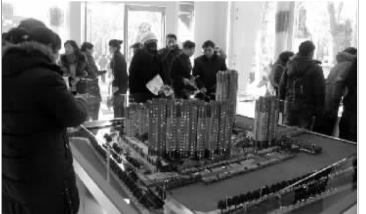
恢弘大气、新颖别致的“幸福花开”楼盘，引来众多市民驻足观看。