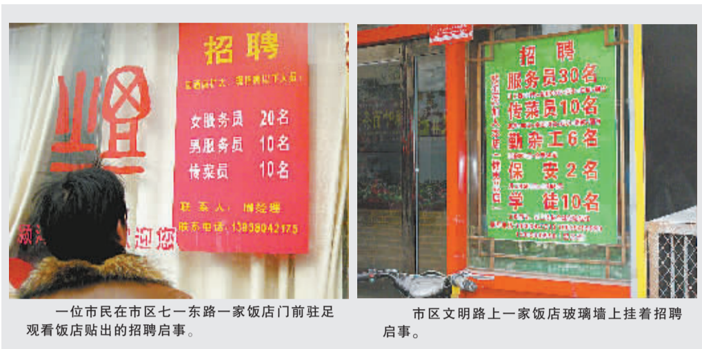
一位市民在市区七一东路一家饭店门前驻足观看饭店贴出的招聘启事。