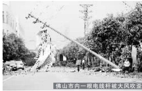
佛山市内一根电线杆被大风吹歪