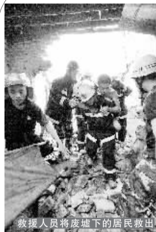
救援人员将废墟下的居民救出