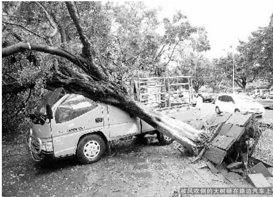
被风吹倒的大树砸在路边汽车上