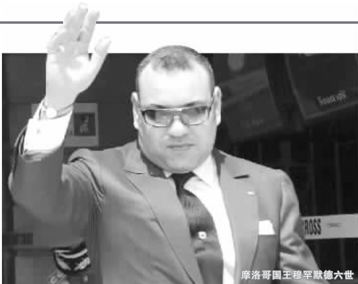
摩洛哥国王穆罕默德六世

摩洛哥司法系统先前因缺乏独立性受到指责。穆罕默德六世提出,由一些法官和国家人权委员会主席组成最高委员会主管司法事务,司法大臣不在这一委员会内。