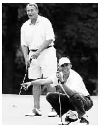
奥巴马与博纳在球场上神情轻松

奥巴马政府与以博纳为首的共和党人在国会就联邦债务上限、对利比亚军事行动等议题分歧明显,一些白宫官员希望,奥巴马借助这场球赛改善与博纳的私人关系,推动两党合作。不过美联社则认为,一场球赛不足以让奥巴马和博纳弥合政策分歧。