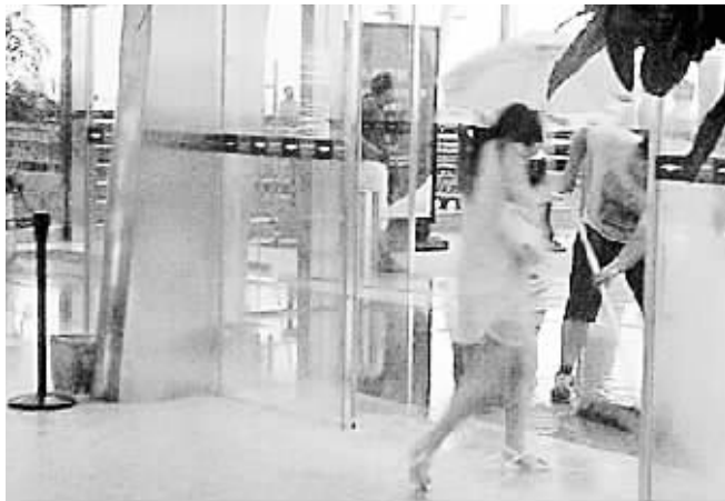
出发厅一号出口处,旅客撑伞从室内匆忙奔出。

8月1日16点40分左右,一场大暴雨突袭长沙,导致黄花机场两个小时所有航班都不能起降。在机场候机的乘客也发现,被大雨困扰的不止飞机,连机场刚刚投入使用13天的新航站楼都“扛不住”了,T2航站楼出发大厅一号出口处也出现了“瀑布”,这一场景被网友上传至微博,立刻成为热帖。