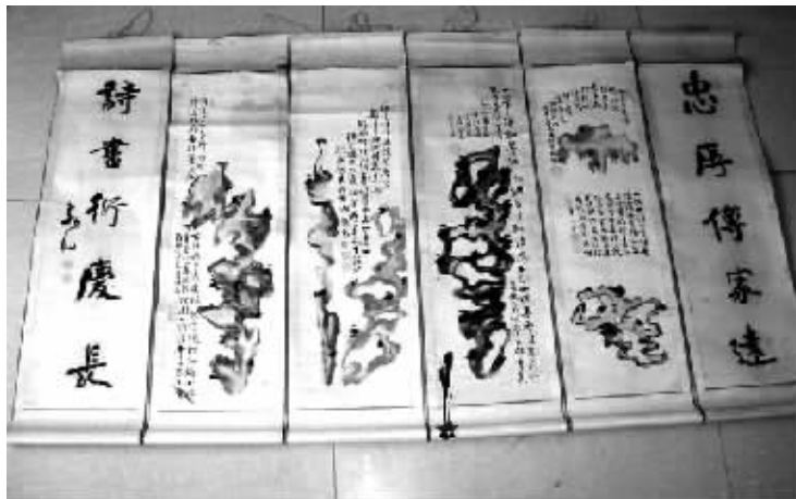
朱炎昭书画作品选