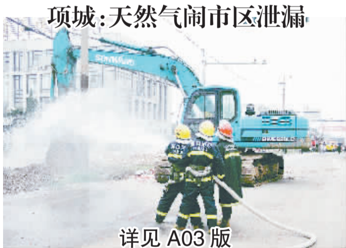
项城:天然气闹市区泄漏

公安部交管局获悉,5月1日《刑法修正案(八)》实施以来,全国共查处酒后驾驶机动车9.5万起,较去年同期下降45.4%。其中,以危险驾驶罪立案查处醉酒驾驶机动车案件1.77万起,较去年同期下降37.9%。全国因酒后驾驶机动车造成交通事故死亡379人,较去年同期减少157人,下降29.3%;醉酒驾驶机动车造成交通事故死亡231人,较去年同期减少85人,下降26.9%。