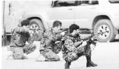
阿富汗士兵在枪战地点附近警戒。

使馆区，其中一枚火箭弹落在私营电视台 TOLO 所在大楼，另一枚落在在一辆运送学生的小型货车附近。电视台画面显示，小型货车着火，一辆自行车倒在路中央，民众在奔跑。袭击发生后，阿富汗警方和安全部队封锁使馆区周边道路。两架北约直升机在附近空中盘旋。