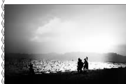
亚龙湾的美丽黄昏