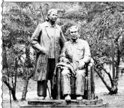
花溪周恩来总理夫妇像