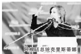
阿根廷总统克里斯蒂娜

本报综合消息 阿根廷总统府国务秘书阿尔弗雷多·斯科奇马罗12月27日宣布,阿根廷总统克里斯蒂娜被诊断患有甲状腺癌,将在明年1月接受手术。