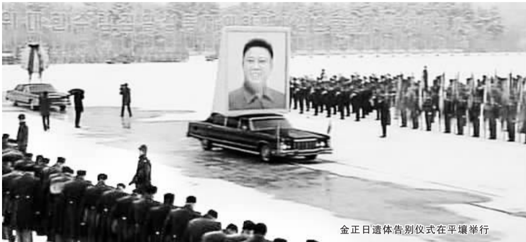
金正日遗体告别仪式在平壤举行

各界群众早早等候在平壤街道两旁。灵车进入平壤市区,沿途经过凯旋门、金日成广场、统一大街等市内标志性建筑和主要街道。在漫天风雪中,肃立的人群看到灵车后爆发出震天哭声。平壤市主要街道当天降下半旗,沿途打出“以最崇敬的心情追悼伟大领导者金正日同志”“伟大领导者金正日同志永生”等标语。