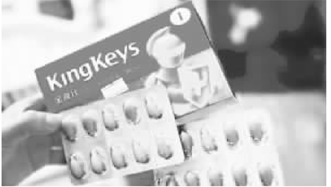
宣称产自挪威的“金奇仕”实为本土企业穿上洋装。

金奇仕方面表示,自己就是一个中国企业。包装上的信息是想反映产品是从挪威进口的,由新西兰方面进行营养素检测和配方咨询。公司确实也有在境外的注册,目的是“方便整合全球资源”。