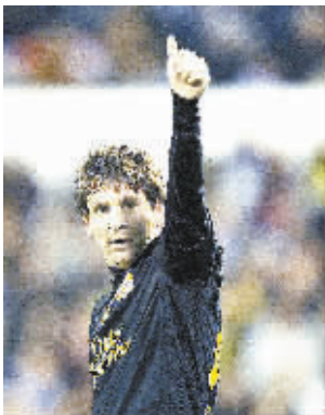
巴塞罗那队球员梅西在比赛庆祝进球

本报综合消息 北京时间 4 月 8 日凌晨，梅西在西甲联赛助巴萨客场 4 比 1 逆转萨拉戈萨，他梅开二度，将 2012 赛季的进球数刷新到 60 大关！50 场比赛，60 个进球，此时没有更美妙的语言来形容梅西了，全世界媒体都在向梅西致敬！