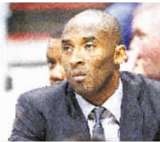
因伤休战的湖人队球员科比·布莱恩特在场边观战

本报综合消息 北京时间 4 月 8 日，洛杉矶湖人客场挑战菲尼克斯太阳，科比·布莱恩特由于左小腿受伤，本赛季首度缺阵常规赛，由德文·伊班克斯顶替进入首发阵容。而对湖人更为不利的消息是，飞侠的伤势恐怕得让他多歇几天。