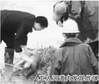
工人河道内发现炸弹