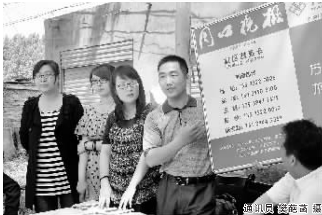
进驻社区记者自我介绍

为此,本报和川汇区社区办以及川汇区辖区内的“一乡八办”共同启动这次便民公益活动。