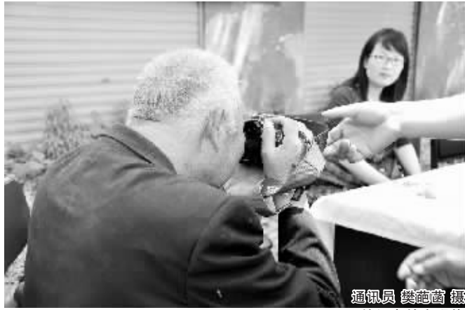
给记者拍张照片