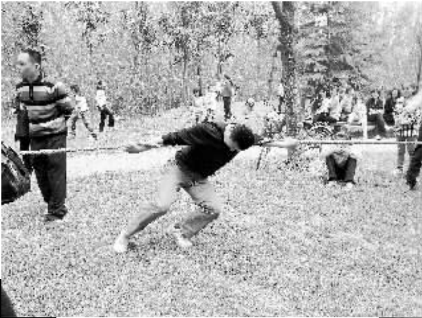
没见过这样拔河。输定了！