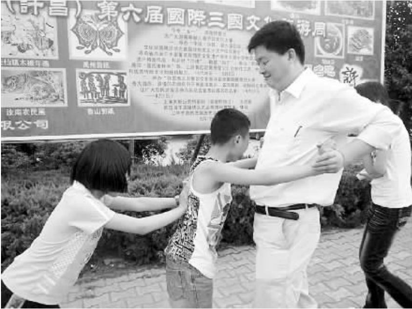
哇呀呀呀！都别拦我，我非把这个恼人的妮子抓住不可！

拍摄作品请直接发送 JPG 格式，不要压缩画面，不要将照片粘贴到 Word 文档中发送，不能通过 QQ 空间转贴照片。请将照片发送到 zkwbdzpp@126.com 或发送离线照片到 QQ:1007853795