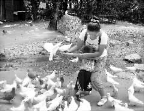
啊，鸽子要啄到我了，妈妈你快让我跑。