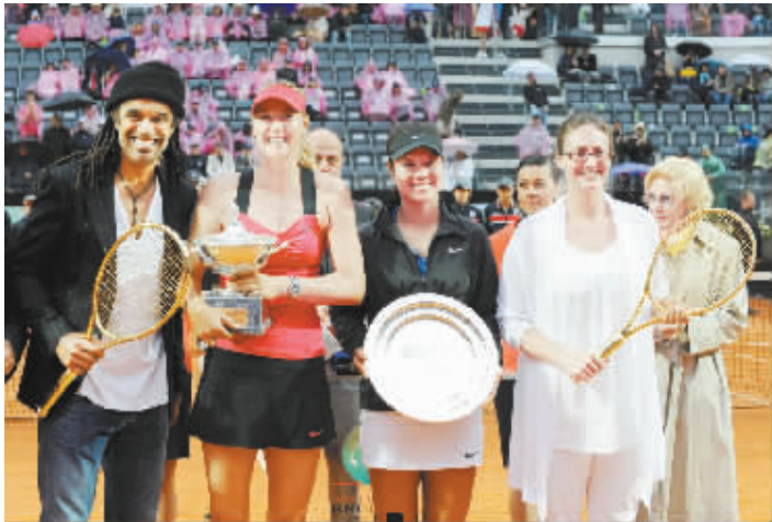
冠军得主莎拉波娃(前左二)、亚军得主李娜(前右二)在颁奖仪式上

本报综合消息 北京时间 5 月 21 日消息,总奖金 2,166,400 美元的超五赛罗马公开赛结束了冠军争夺