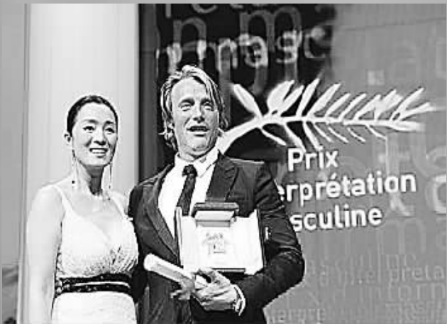
巩俐为麦德斯·米科尔森颁奖