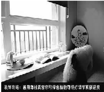
装饰攻略:善用薄材质窗帘和绿色植物调节室内温度

一般家庭中应该备有冬夏两套不同厚度、不同色系的窗帘,冬季使用厚窗帘可以保温、防寒,而夏季适合挂薄的、看起来淡雅的窗帘。夏季的窗帘颜色以白色、米色、褐色等色调为主。如果家中的窗户是朝东向或朝西向的,建议在薄窗帘上加装一层有显著隔热功能的防紫外线窗帘。同时,在居室内摆放室内植物,可以减少室内的干燥,同时可吸收室内的二氧化碳,而且适当的盆栽植物搭配还能使室内环境变得自然、和谐。(陈小虹)