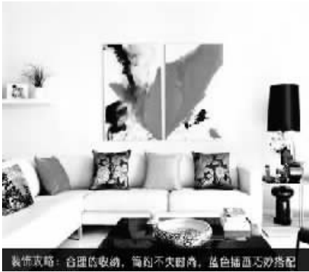
装饰攻略:合理的收纳,简约不失时尚,蓝色插画巧妙搭配

及时收纳小户型空间不容易表现出简洁明快的感觉,尤其空间不足,增加屋内装饰的同时也会存在很多来不及收纳的问题,右图中这个客厅空间,采用了现代简约风格的设计,加入合理的收纳规划,为了使简约空间不失时尚,还在挑选装饰做了一些取舍,如选用蓝色插画巧妙搭配,从视觉上满足夏季空间清爽的需求。提升墙面利用空间也是个办法,我们可以为墙面装饰上简单的置物架,搭配上绿色的小植物,让空间变得生机勃勃。