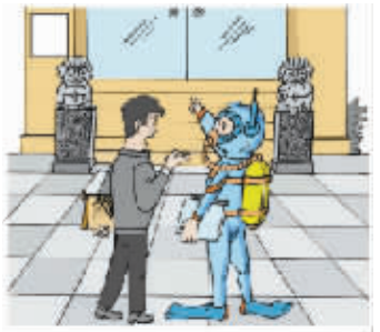
▲——你到这里办事为何如此打扮? ——听说这里潜规则的“水”太深。