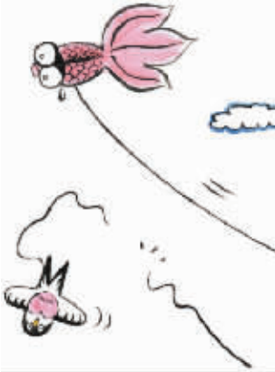
▲必要的约束也是一种保护