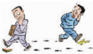
▲嘲笑别人之前最好先看看自己的脚下

孩子想要啥 一人抱着孩子乘公交车,座位刚好在司机旁边。坐了不一会儿,小孩子就哭闹个不停,任那人怎么哄都不肯罢休。 司机终于被哭烦了,他转过脸冲那人嚷嚷:“老训孩子干什么?他要什么给他不就得了?” 那人说:“那不行啊,孩子想要你的方向盘!”