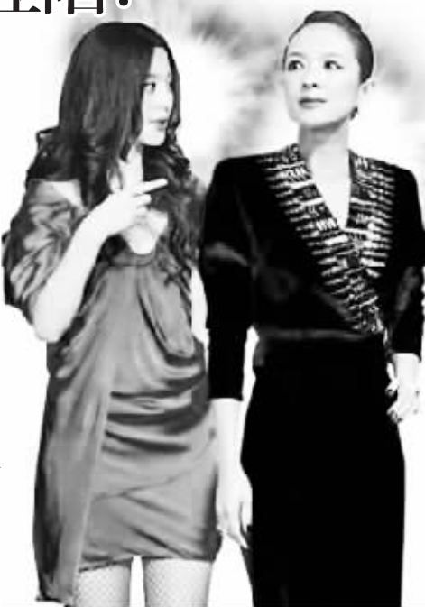
章子怡(右)出道后迅速蹿红,范冰冰(左)近年则靠在国际影展争取曝光,打响知名度。

不过,也有网友力撑范冰冰,并贴上她的言论打气——“范冰冰说:我挨得住多深的诋毁,就经得住多大的赞美。范冰冰说:我的所有努力都只是为了让自己掌握主动。范冰冰说:别人说好不好不重要,我喜欢就好。范冰冰说:我从来就不是为了别人而活。范冰冰说:万箭穿心,习惯就好!”(颖颖)