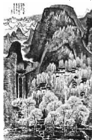
李可染画作《万山红遍》