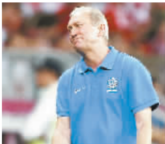
波兰主教练斯穆达赛后宣布下课