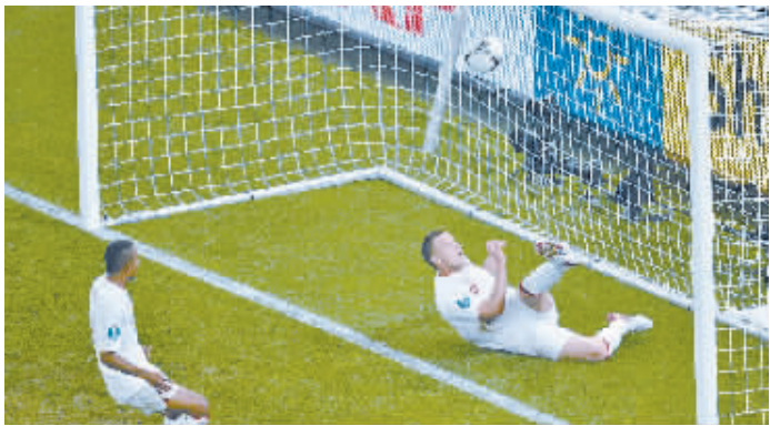
特里(右)门线内解围

新华社顿涅茨克6月19日电 英格兰队成为了“门线冤案”的受益方！欧锦赛小组赛最后一轮D组的比赛19日结束，在英格兰队和乌克兰队的比赛中，“三狮军团”依靠鲁尼的进球，1比0战胜乌克兰队以小组第一晋级，遭遇“门线冤案”的乌克兰则垫底出局。至此本届欧洲杯两个东道主全部出局。