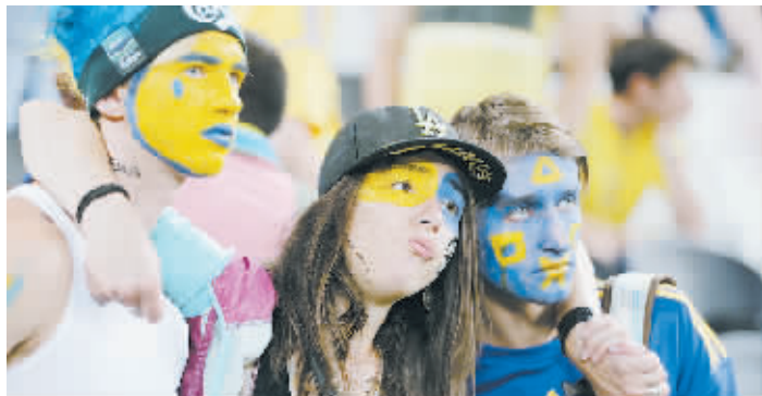
乌克兰球迷在比赛后神情沮丧

新华社基辅6月19日电 法国队19日在D组最后一场小组赛中，虽然0比2不敌瑞典，仍以小组第二晋级八强，将在四分之一决赛中迎战卫冕冠军西班牙队。