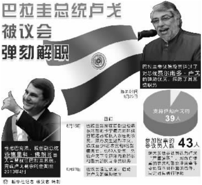
图表：巴拉圭总统卢戈被议会弹劾解职

拉总统查韦斯等领导人也明确表态，不承认新总统弗朗哥，并将采取集体行动制裁巴拉圭新政府。 分析人士认为，南美国家的集体抵制和制裁将使巴拉圭新政府面临严峻考验。