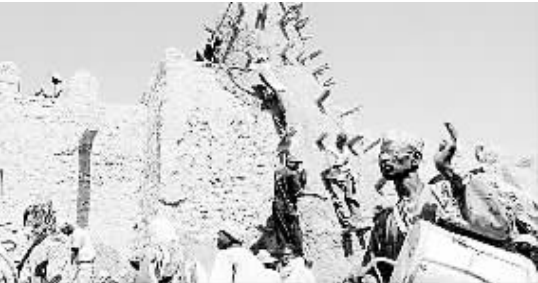
“伊斯兰捍卫者”破坏通布图古城

“伊斯兰捍卫者”据信关联“基地”组织。马里今年 3 月发生政变，“伊斯兰捍卫者”乘机扩大势力范围，不久前宣称控制北方大部分地区。