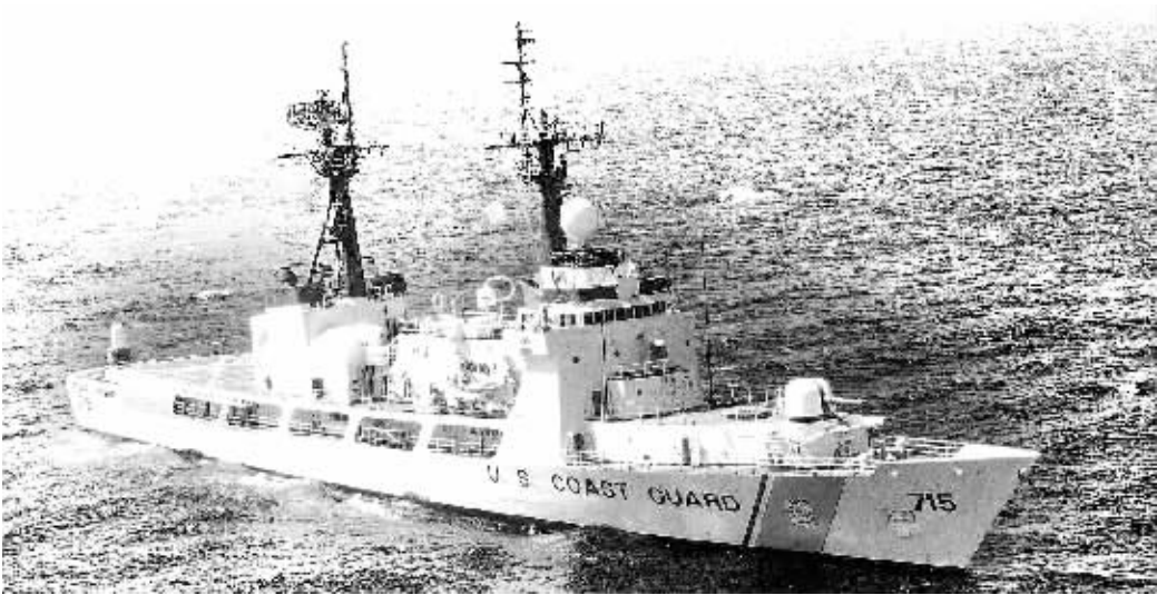
资料照片：“汉密尔顿”级巡逻舰