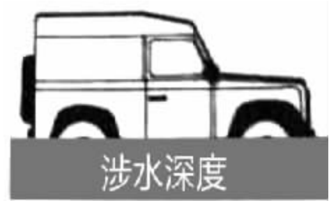
图 1 涉水深度

再比如,雷雨天要收起天线,千万不要下车避雨——倘若闪电击中汽车,在车内反而是安全的;但也不要将车停在树下,以防雷击。