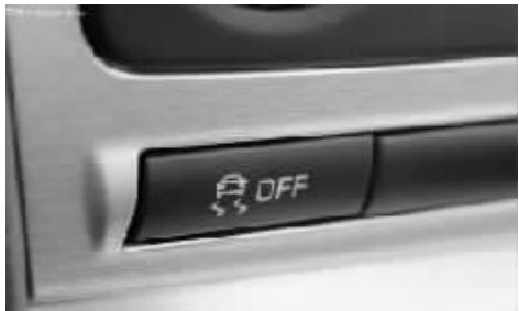
图 2 有些车型上的 ESP 关闭键只有图标