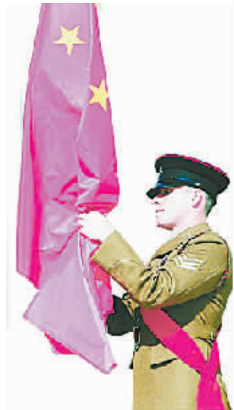
仪仗队士兵在升中国国旗。

们面向国旗敬礼,表情肃穆神色坚毅。仪式过后演出继续,他们和各国选手一道载歌载舞。对“快乐奥运”的享受,在这一刻的不经意间尽情流露。 罗格曾说,伦敦奥运会将是一场“盛大的运动会”。然而在这场盛会中,能够“激励一代人”的绝不仅仅是金牌和世界纪录。在竞技比赛之外,奥运更象征着和平、友谊和团结。不分种族和语言,人们依偎在五环旗下,放松而真诚,这正是奥林匹克运动的真谛。我想,伦敦奥运会在升旗仪式上的大胆改变,正契合这“快乐奥运”的精神。 殷局长称精彩 易立留恋 将严肃的升旗仪式,改成一幕舞台剧,伦敦奥运会的“出新”效果如何?升旗仪式结束后,记者从刘鹏局长脸上的微笑,江苏体育局局长、中国代表团副秘书长殷宝林的交口称赞以及江苏籍篮球明星易立的流连忘返中感受到,这场游戏,还真俘获了众人心。 中国体育代表团团长刘鹏仪式结束后,接受记者采访时,一脸轻松,他心中的包袱,被英国国家青年剧院的歌舞演员们踢到了九霄云外。在仪式进行中,刘局长就一直沉浸在欢乐的气氛中,甚至还不忘与身边的几位副手谈笑风生,这样的好心态,在奥