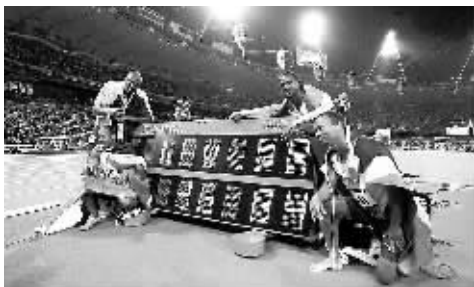
牙买加队队员在打破纪录后与电子记分牌合影

本报综合消息 冲过终点线的“闪电”博尔特不愿交出手中的接力棒。他飞速闪过志愿者，亲吻着接力棒。