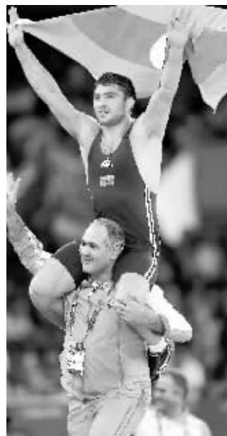
当地时间8月11日，在伦敦奥运会男子自由式摔跤84公斤级决赛中，阿塞拜疆选手沙里福夫获得冠军。