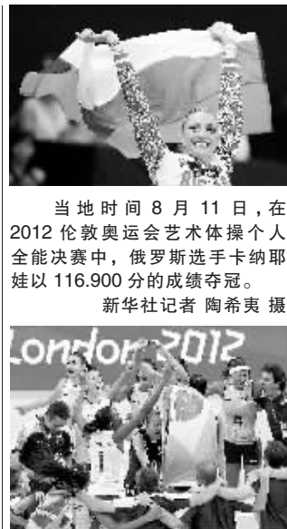
当地时间8月11日，在2012年伦敦奥运会女子排球决赛中，巴西队以3比1战胜美国队，夺得冠军。