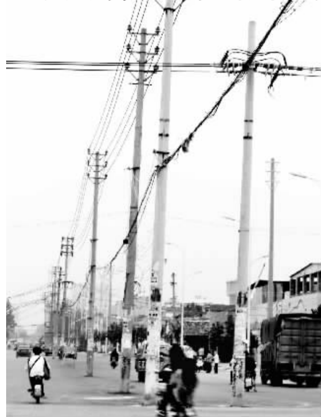
记者昨日在市区莲花路与五一路交叉口附近看到,10 余根电线杆杵在五一路中间,给行人带来极大不便。不少市民建议有关部门尽快挪走这些“路桩”。