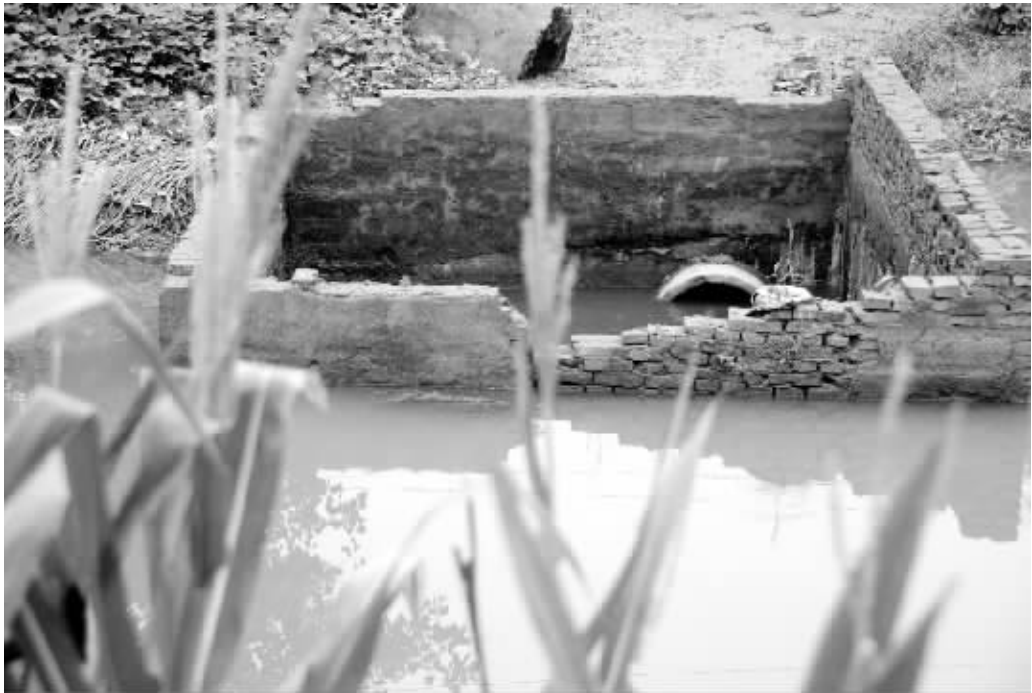
□晚报记者 朱海龙 文/图

本报讯“现在我们大半个村子的地下水都不能吃了,罪魁祸首是村子里的污水管道往外漏水。”近日,周口开发区许寨村村民许先生拨打本报新闻热线反映称,他们村子里的污水管道漏出的污水流进了村子里的水坑,导致大半个村子的地下水无法使用。记者了解到,许寨