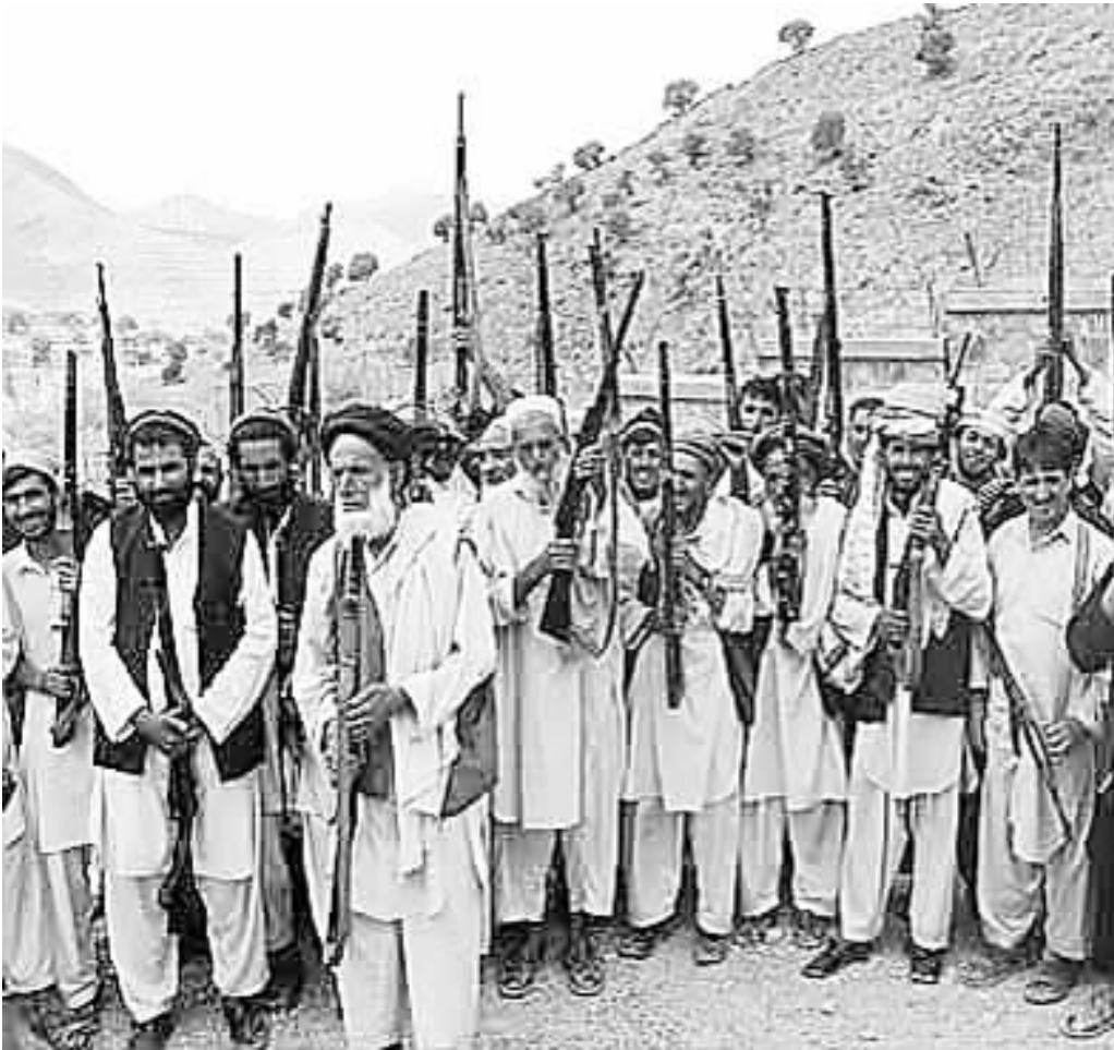
8 月 27 日,阿富汗民众高举武器,誓言打击塔利班武装分子,捍卫自己的土地。

17 名平民惨遭斩首数小时后,塔利班武装分子 27 日凌晨发起一场夜间袭击,占领赫尔曼德省瓦希尔区的一个政府军哨所,杀死 10 名官兵。穆罕默德·伊斯梅尔·霍塔克上校说,这