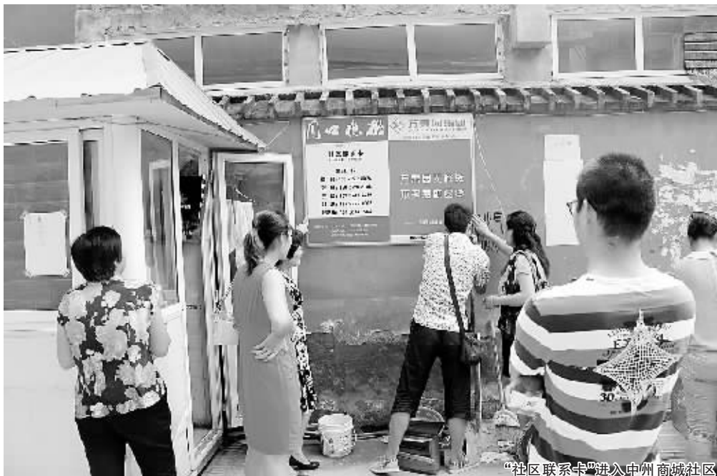
“社区联系卡”进入中州商城社区