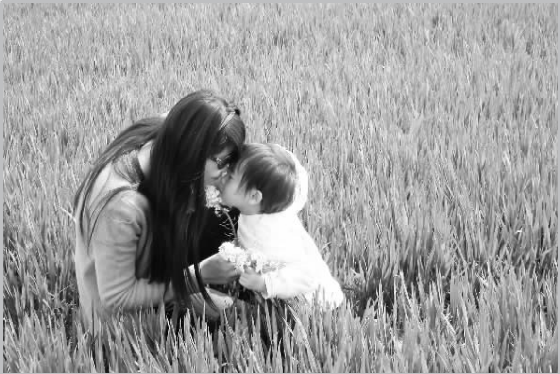
春天的温暖怎及妈妈的吻

拍摄作品请直接发送 JPG 格式，不要压缩画面，不要将照片粘贴到 Word 文档中发送，不能通过 QQ 空间转贴照片。请将照片发送到 zkwbdzpp@126.com 或发送离线照片到 QQ：1007853795