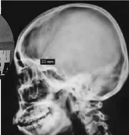
X片显示针头“斜插”进入额骨(资料照片)