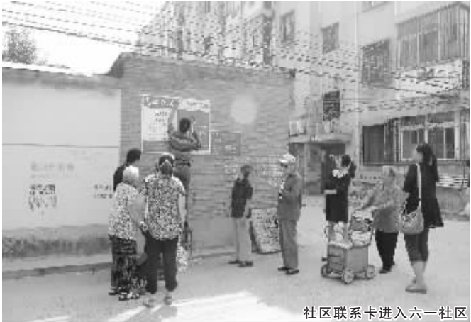
社区联系卡进入六一社区

该社区有多家行政事业单位, 多家公立及私立学校, 还有众多商业店面, 可以说, 这个社区是我市中心城区集行政、商业、教育功能于一身的多功能社区。