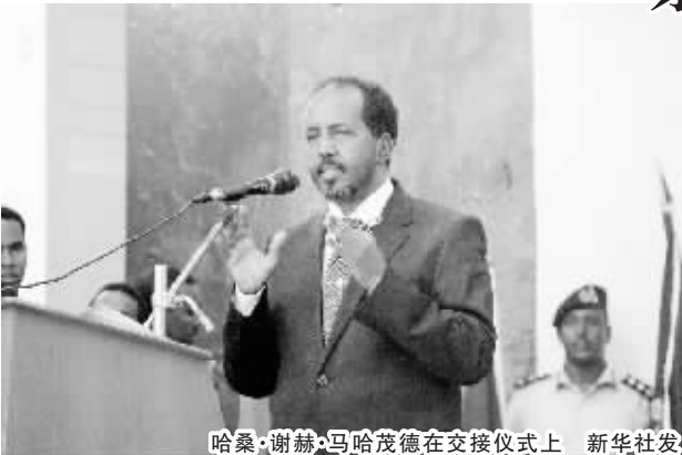
哈桑·谢赫·马哈茂德在交接仪式上

发展作出贡献。 在9月10日举行的索马里总统选举中,马哈茂德得到索议会议员支持,以190票比79票的压倒性优势,战胜艾哈迈德,成为索马里21年来首位由联邦议会选出的总统。 索反政府武装“伊斯兰青年运动”表示将继续发动针对索政府及非盟特派团的袭击。9月12日,马哈茂德在首都一家酒店会见来访的肯尼亚外长时遭“伊斯兰青年运动”袭击,所幸并未受伤。