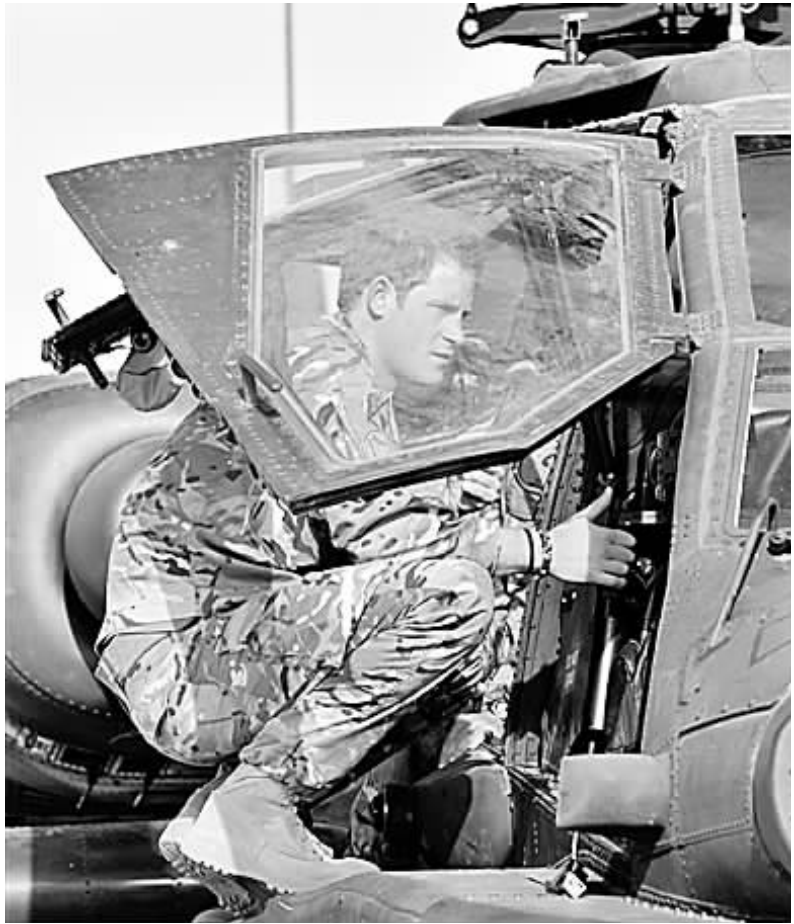
9 月 7 日,哈里王子抵达巴斯申营地,第二次进驻阿富汗战场。作为“阿帕奇”式武装直升机射手,他预定服役 4 个月。

围的检查站,从隐藏在沙漠里的装备存放点获取武器。 “这次袭击策划和执行都非常好,”一名军方人员说,“携带重武器闯入基地,需要做大量准备,他们不可能几个小时就完成。他们开火之前,我们没认出他们是敌人。他们知道这一点,因而小心谨慎,抵达营地防护网前不暴露武器。”