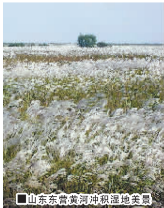
■山东东营黄河冲积湿地美景

随着金秋季节的来临,眼下,许多地方白天气温仍然居高,不过我国的西北、东北等北方地区以及西南高原地区却已有了浓浓秋日的气息,那些最美且最具不凡特征的金色正在悄然展开。对市民来说,现在是寻找五彩斑斓、诗情画意秋日最好的时机。