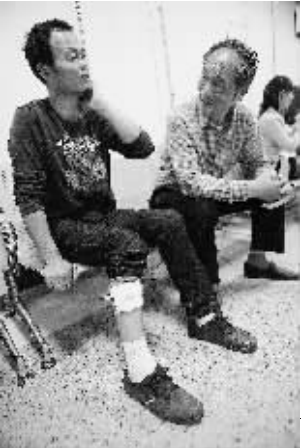
受伤者在医院治疗。