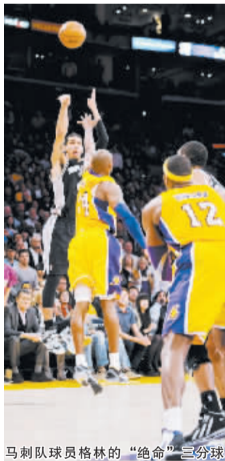
马刺队球员格林的“绝命”三分球

其他两场比赛，夏洛特山猫队主场 92:76 大胜华盛顿奇才队，萨克拉门托国王队主场 86:103 不敌波特兰开拓者队。