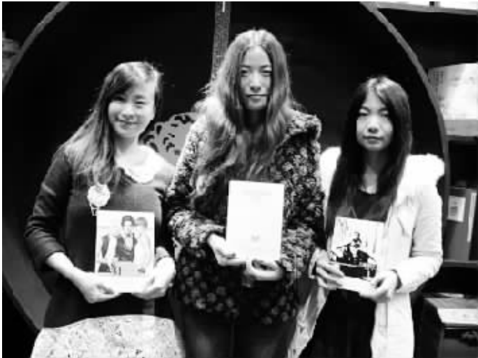
自由鸟、落落、余慧迪(左起)

本报综合消息 12月1日,著名80后青年作家落落,携新作《剩者为王II》到南京凤凰国际书城,与读者面对面交流,并邀请上海资深科幻小说作家自由鸟,才女余慧迪作为友情嘉宾同场签售。