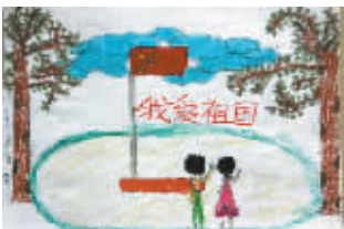
我爱祖国 小记者：化雨 编号：5757 学校：六一路小学五(1)班