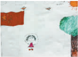
我的国庆 小记者：张晗 编号：7318 学校：作坊小学三(1)班

本栏目刊发小记者用相机拍摄的作品。想要当一名合格的小记者，学摄影必不可少，从今天起把你眼中最美的景、最想留下的瞬间拍下来吧，挑选出感觉不错的“片子”发送到 zkwbcxy@126.com