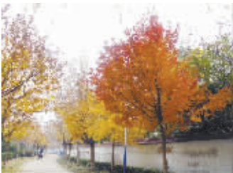
秋色 小记者：孔泉 编号：7770 学校：闫庄小学五(1)班