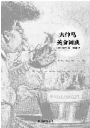
《大仲马美食词典》,[法]大仲马著,杨荣鑫译,译林出版社 2012 年出版

大仲马曾为一家名为《新潮》的期刊开设专栏《美食漫谈》,这是一个类似聊天的栏目,话题经常会转到厨艺方面。小说家在他人生的最后几年把精力几乎全投到这个专栏上了。从专栏中以下一段话可以看出,《三个火枪手》的作者对此有多么自豪: