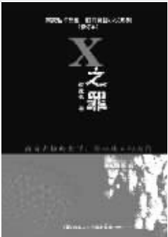
■《X之罪》 何家弘 著 中国人民大学出版社

每年有数以十万只的猫咪流离失所,频繁发生的虐待动物事件一而再再而三地挑战观者的承受底线。一本包含着作者“希望唤回日益冷漠的人性”温暖心意的“猫咪情书”感动了亿万读者。带着“不仅珍爱自己的猫咪,也善待身边流浪的猫咪”美好期待,书中介绍了各种关于猫咪的有趣故事,包括猫咪经常向我们展现的懒惰美学,猫咪的独特习性,还有包括猫咪的各种用途和利用法等内容。