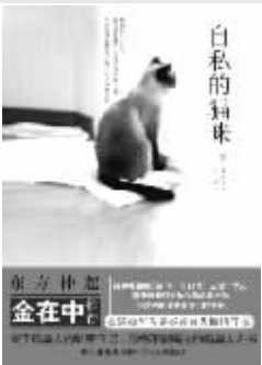
■《自私的猫咪》 【韩】李周禧 著 新星出版社

每年有数以十万只的猫咪流离失所,频繁发生的虐待动物事件一而再再而三地挑战观者的承受底线。一本包含着作者“希望唤回日益冷漠的人性”温暖心意的“猫咪情书”感动了亿万读者。带着“不仅珍爱自己的猫咪,也善待身边流浪的猫咪”美好期待,书中介绍了各种关于猫咪的有趣故事,包括猫咪经常向我们展现的懒惰美学,猫咪的独特习性,还有包括猫咪的各种用途和利用法等内容。