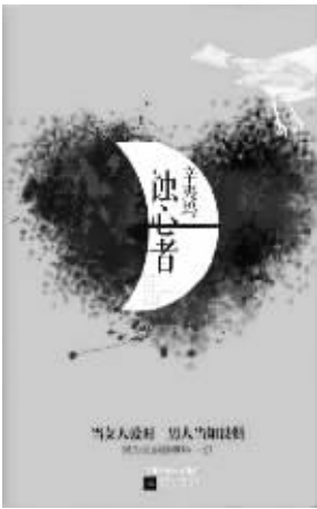
《蚀心者》,辛夷坞著,江苏文艺出版社 2012 年 12 月出版

家族,如今早已迁徙出故地,只剩一个 70 多岁的老园丁和傅家的一个被遗弃的私生子守着曾经的记忆。几房后代里,有的繁华,有的落寞,飘散在各地,已无联系,却不曾想那点血脉最终会因为利益之争而再次“团聚”。然而最终的讽刺并不针对这个豪门内斗,辛夷坞写的还是爱情,这一次的爱情,不是我们熟悉或期待的那个面孔。至少,从发生的那一刻,就多少带了一点传奇性。之后作者完全擦除了家族关系带来的年代感,反而借由男女主人公的爱情挣扎让时下所有的人性现实实现了一次高技术含量的并