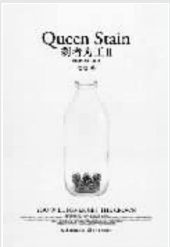
■《刺者为王 II》 落落 著 长江文艺出版社

在一个偏僻宁静的山村里发生了一连串诡异怪诞的事情。一个村民突然死亡,被法医鉴定为过量服用了巴豆水。他的妻子被指控“通奸毒害亲夫”。这似乎是一个被前人重复过无数次的故事。但是,故事的主人公究竟是“西门庆和潘金莲”,还是“杨乃武与小白菜”?洪律师和宋佳历经艰险,终于查明真相。这个案件背后折射出来的渎职犯罪和司法权威被忽视等社会问题,更发人深省。