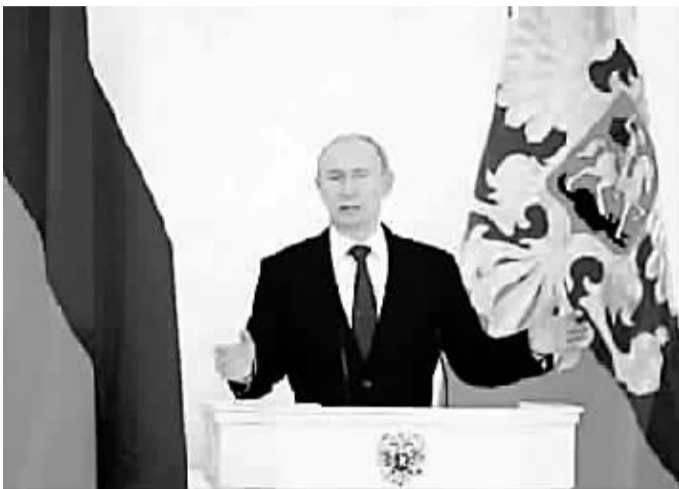
普京发表年度国情咨文

他说，俄罗斯大型企业签署的近九成商业协议不受俄罗斯法律约束，不少俄罗斯企业在国外注册以规避税收。他敦促政府努力推动离岸企业透明化以及纳税信息公开化，更需要反思司法、立法和执法方面的错误。“让商业活动爱国的最佳方式是给私人财产提供更加有效的保障，使俄罗斯司法有吸引力。”