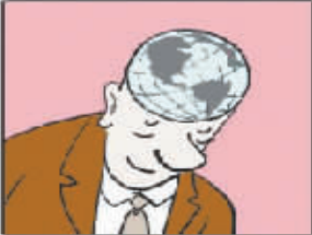
思想的出现改变了世界的面貌。 ——夏尔丹