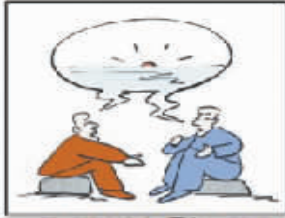
读书使人充实,思考使人深邃,交谈使人清醒。 ——富兰克林