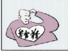
广泛地吸取真理,是为了保证不在心中装填谬误。 ——纪德